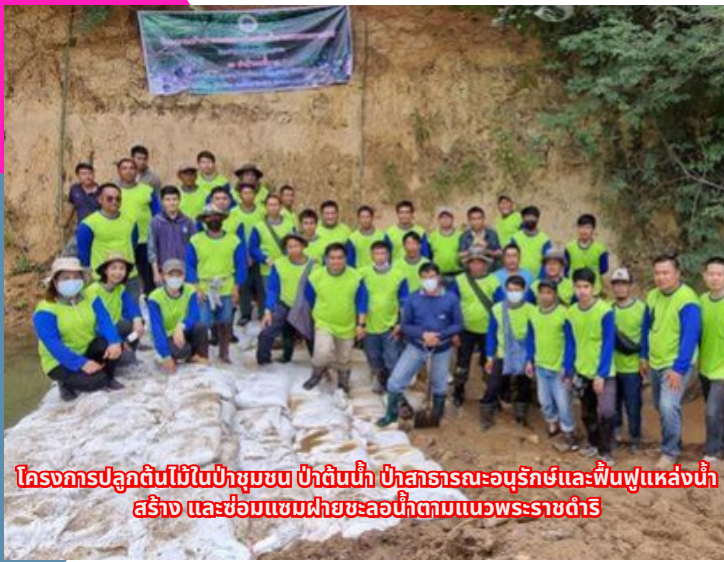
โครงการปลูกต้นไม้ในป่าชุมชน ป่าต้นน้ำ ป่าสาธารณะอนุรักษ์และฟื้นฟูแหล่งน้ำ สร้าง และซ่อมแซมฝายชะลอน้ำตามแนวพระราชดำริ