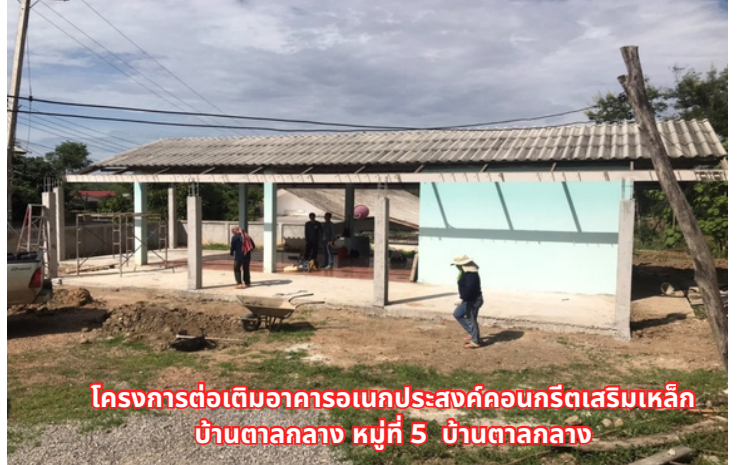
โครงการต่อเติมอาคารเอนกประสงค์คอนกรีตเสริมเหล็ก บ้านตาลกลาง หมู่ที่ 5 บ้านตาลกลาง