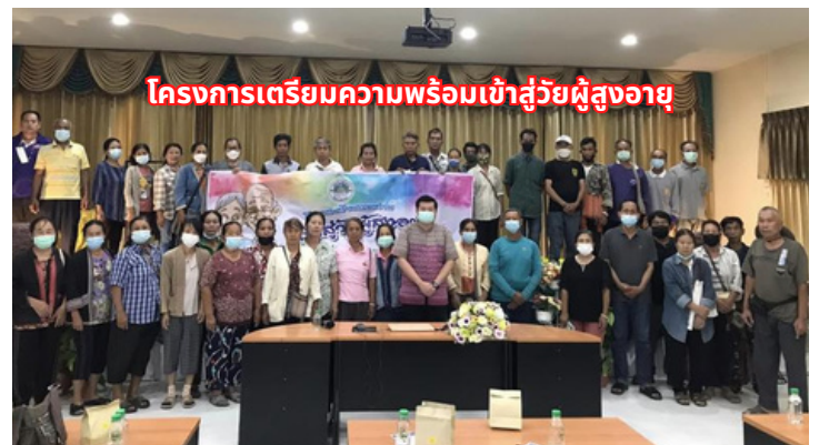
โครงการเตรียมความพร้อมเข้าสู่วัยผู้สูงอายุ