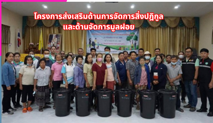
โครงการส่งเสริมด้านการจัดการสิ่งปฏิกูล และด้านการจัดการมูลฝอย