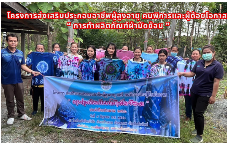
โครงการส่งเสริมประกอบอาชีพผู้สูงอายุ คนพิการและผู้ด้อยโอกาส " การทำผลิตภัณฑ์ผ้ามัดย้อม "