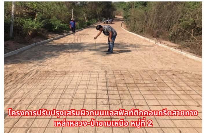
โครงการปรับปรุงเสริมผิวถนนแอสฟัลต์ติกคอนกรีตสายทาง เหล่าหลวง-ป่าขามเหนือ หมู่ที่ 2