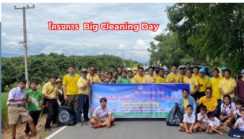
โครงการ Big Cleaning Day