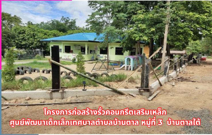
โครงการก่อสร้างรั้วคอนกรีตเสริมเหล็ก ศูนย์พัฒนาเด็กเล็กเทศบาลตำบลบ้านตาล หมู่ที่ 3 บ้านตาลใต้