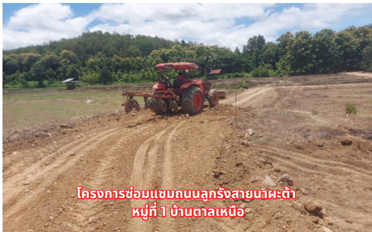
โครงการซ่อมแซมถนนลูกรังสายนาพะต๋า หมู่ที่ 1 บ้านตาลเหนือ