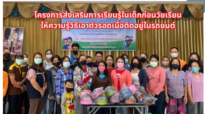
โครงการส่งเสริมการเรียนรู้ในเด็กก่อนวัยเรียน ให้ความรู้รีเอเตอร์รถเมื่อติดอยู่ในรถยนต์