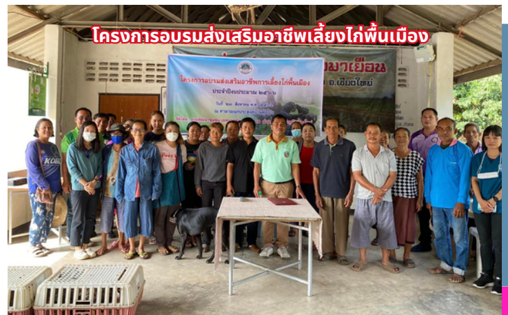
โครงการอบรมส่งเสริมอาชีพเลี้ยงไก่พื้นเมือง