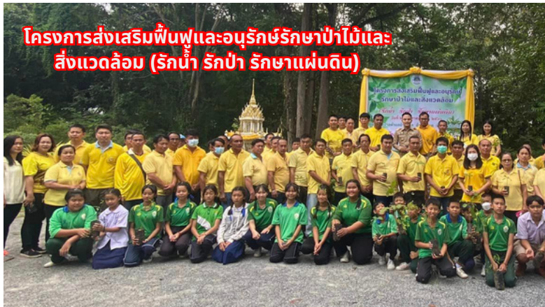
โครงการส่งเสริมฟื้นฟูและอนุรักษ์รักษาป่าไม้และสิ่งแวดล้อม (รักษาน้ำ รักษาป่า รักษาแผ่นดิน)