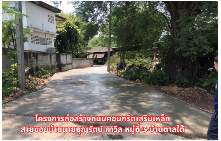
โครงการก่อสร้างถนนคอนกรีตเสริมเหล็ก สายซอยบ้านนายบุญรัตน์ กาวิล หมู่ที่ 3 บ้านตาลใต้