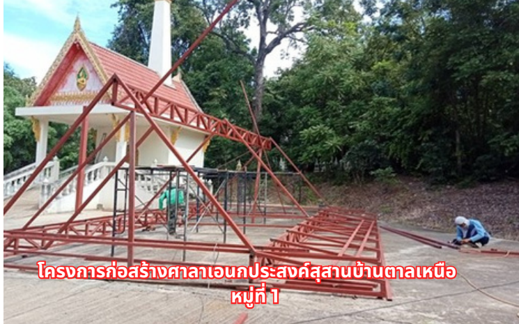
โครงการก่อสร้างศาลาเอนกประสงค์สุสานบ้านตาลเหนือ หมู่ที่ 1