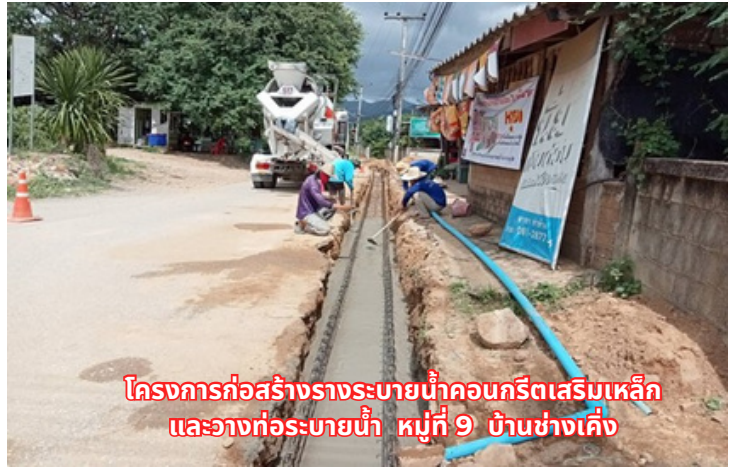
โครงการก่อสร้างรางระบายน้ำคอนกรีตเสริมเหล็ก และวางท่อระบายน้ำ หมู่ที่ 9 บ้านช่างเคิ่ง