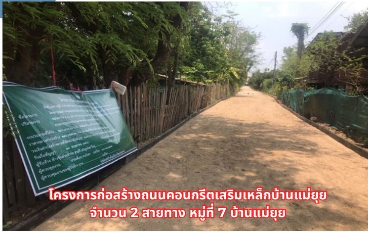
โครงการก่อสร้างถนนคอนกรีตเสริมเหล็กบ้านแม่ฮุย จำนวน 2 สายทาง หมู่ที่ 7 บ้านแม่ฮุย