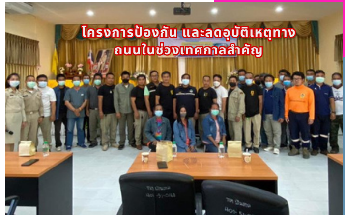
โครงการป้องกัน และลดอุบัติเหตุทางถนนในช่วงเทศกาลสำคัญ