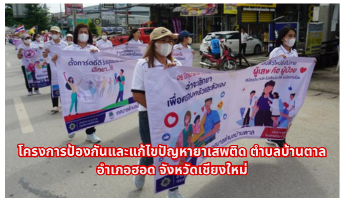
โครงการป้องกันและแก้ไขปัญหาหยาเสฟติด ตำบลบ้านตาล อำเภอสอด จังหวัดเชียงใหม่