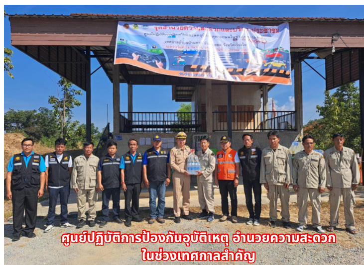
ศูนย์ปฏิบัติการป้องกันอุบัติเหตุ อำนวยความสะดวก ในช่วงเทศกาลสำคัญ