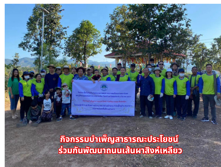
กิจกรรมบำเพ็ญสาธารณะประโยชน์ ร่วมกันพัฒนาถนนเส้นผาสิ่งห้เหลียว