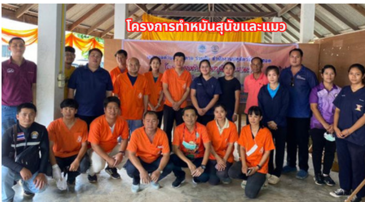
โครงการทำหมันสุนัขและแมว