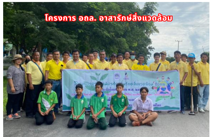
โครงการ อกล. อาสาสมัครสิ่งแวดล้อม