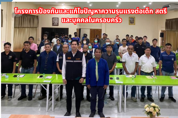
โครงการป้องกันและแก้ไขปัญหาคาความรุนแรงต่อเด็ก สตรี และบุคคลในครอบครัว