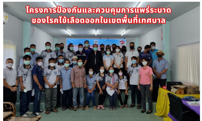
โครงการป้องกันและควบคุมการแพร่ระบาดของโรคไข้เลือดออกในเขตพื้นที่เทศบาล