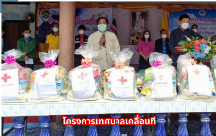
โครงการเทศบาลเคลื่อนที่