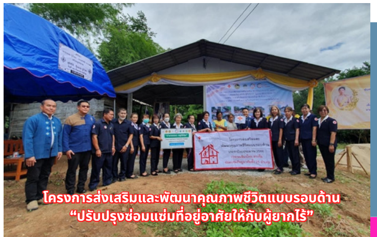
โครงการส่งเสริมและพัฒนาคุณภาพชีวิตแบบรอบด้าน “ปรับปรุงซ่อมแซมที่อยู่อาศัยให้กับผู้ยากไร้”