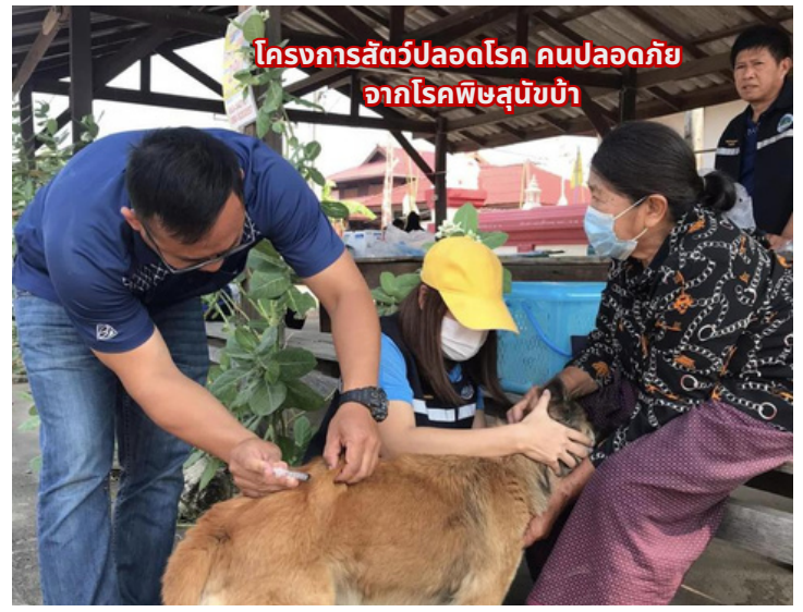
โครงการสัตว์ปลอดโรค คนปลอดภัย จากโรคพิษสุนัขบ้า