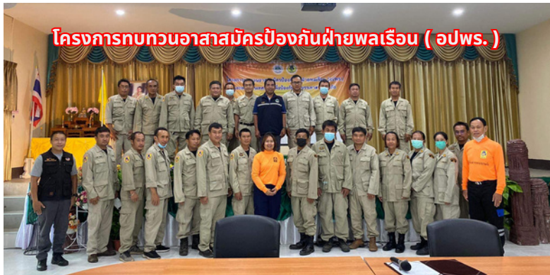
โครงการทบทวนอาสาสมัครป้องกันภัยพลเรือน (อปพร.)