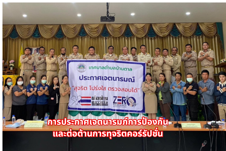
การประกาศเจตนารมณ์การป้องกัน และต่อต้านการทุจริตคอร์รัปชัน