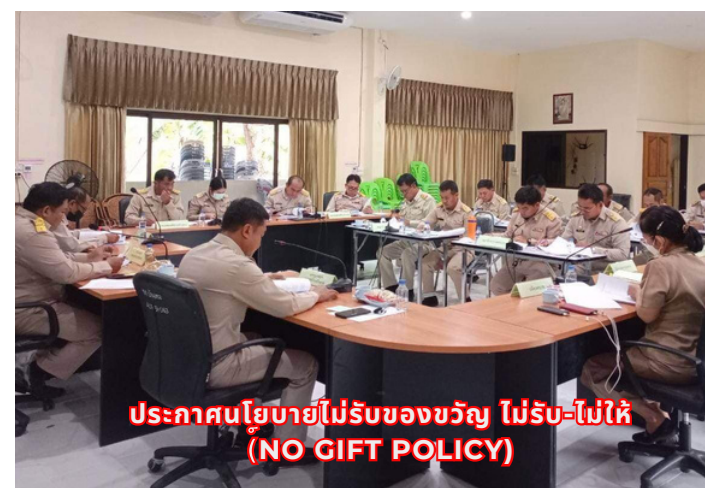
ประกาศนโยบายไม่รับของขวัญ ไม่รับ-ไม่ให้ (NO GIFT POLICY)