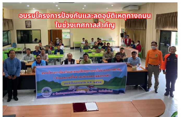
อบรมโครงการป้องกันและลดอุบัติเหตุทางถนน ในช่วงเทศกาลสำคัญ (ช่วงเทศกาลปีใหม่ และช่วงเทศกาลสงกรานต์) ประจำปีงบประมาณ พ.ศ. ๒๕๖๕